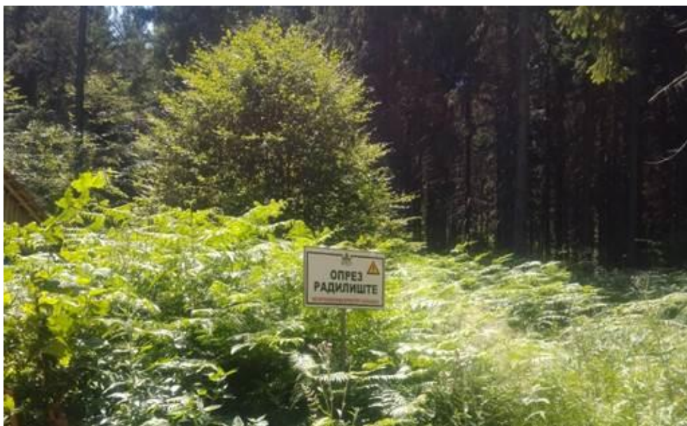
Фотографија бр. 1