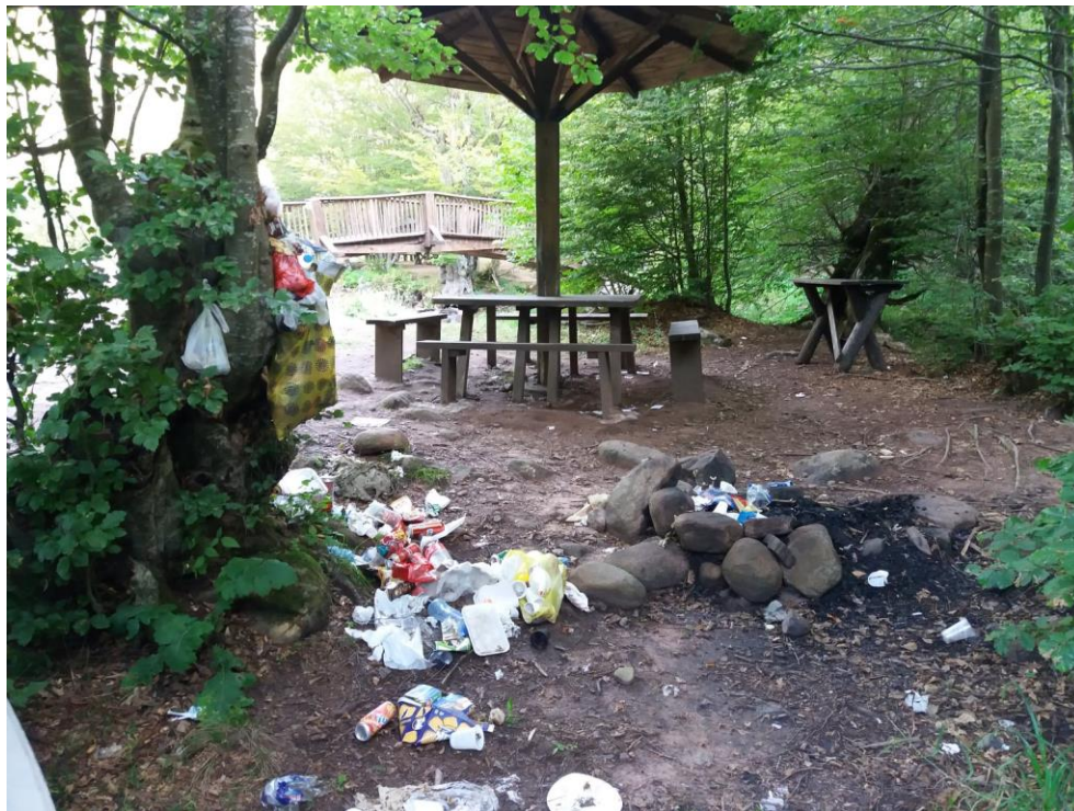
Фотографија бр. 2

Одржавање чистоће и управљање отпадом на подручју Парка природе врши се у складу са Законом о управљању отпадом („Службени гласник РС”, бр. 36/09 и 88/10), прописима донетим на основу тог закона, другим законима и прописима који се односе на отпадне материје, Уредбом и овим правилником.