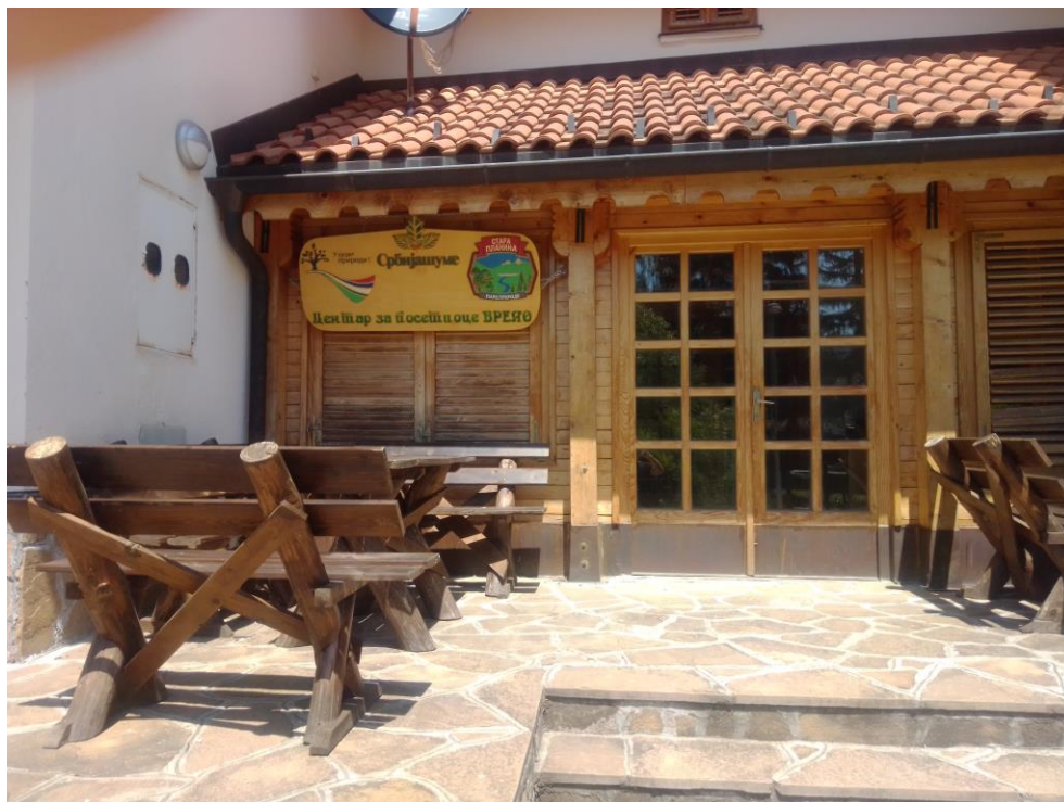
Фотографија бр. 3

Очигледно је да бројне едукативне активности о лековитом биљу нису дале никакве резултате, с обзиром да није било заинтересоване стране за коришћење неких од споредних шумских производа. Тешко је поверовати да на подручју Парка природе „Стара планина“ најпростиранијег заштићеног природног добра у Србији са огромним потенцијалима и могућностима за развој неке од привредних грана везаних за споредне шумске производе, није било никога заинтересованог.